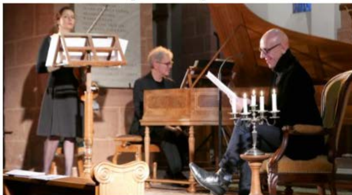
Le trio a défendu brillamment le projet.