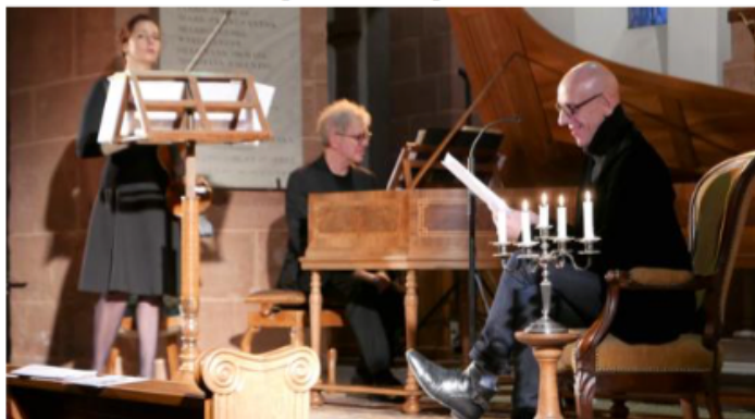
Le trio a défendu brillamment le projet.