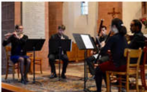
Cinq instrumentistes prometteurs.

Tantôt à cinq, tantôt à trois et en solo, les cinq instrumentistes de l'Académie supérieure de musique de Strasbourg ont servi, avec talent et conviction, un répertoire d'une belle diversité.